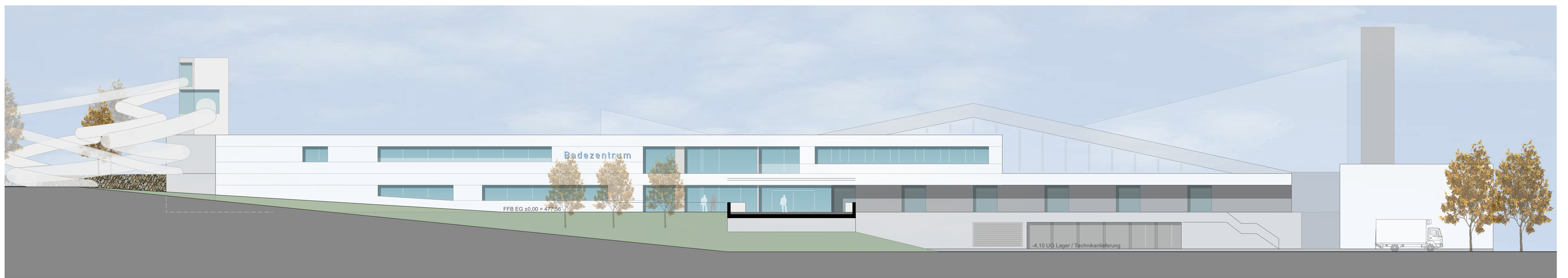
Ansicht Nord M 1 200